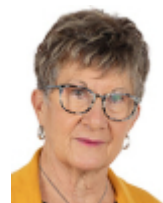
Marie-Claude Varailles Sénatrice de Dordogne mc.varailles@senat.fr