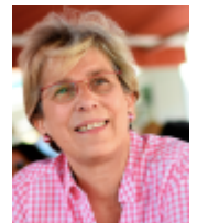
Marie-Noëlle Lienemann Sénatrice de Paris mn.lienemann@senat.fr