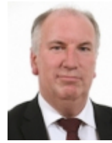
Eric Bocquet Sénateur du Nord e.bocquet@senat.fr