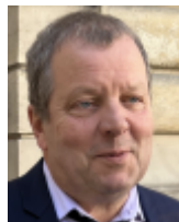
Pascal Savoldelli Sénateur du Val-de-Marne p.savoldelli@senat.fr