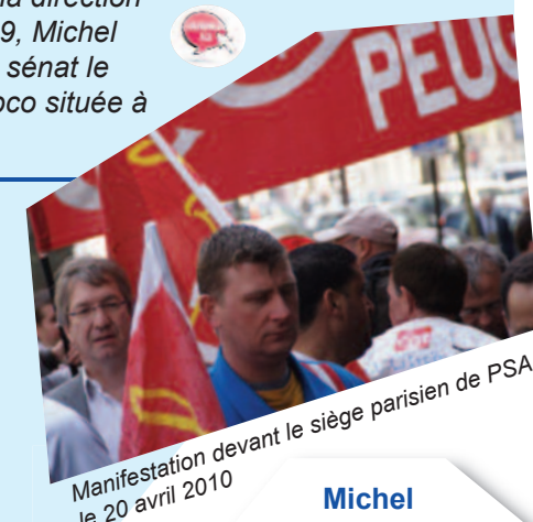
Manifestation devant le siège parisien de PSA le 20 avril 2010

Michel Billout fait le point sur la situation de l'emploi en Seine-et-Marne (le 10 avril 2010)